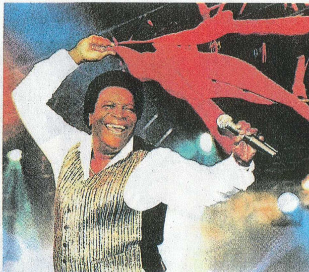
Stimmungskanone: Roberto Blanco kommt nach Peine.

Deshalb sei er die ideale Besetzung für dieses Konzert – zumal der temperamentvolle Künstler wie kein Zweiter Lebensfreude und Spaß im Alter verkörpert. Das Konzert fin-